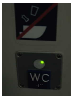
Beschriftung Innen - taktile erfassbar

Es sind Informationen vorhanden, die der Orientierung dienen und aus Wörtern bestehen.