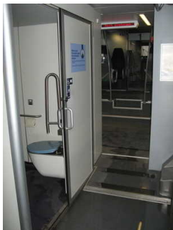
WC - Flur vom Mehrzweckbereich

Anmerkungen für den Gast: Alarmknopf rechts neben WC