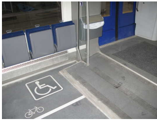
Neigung zu Rollstuhlplätzen