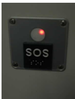
Beschriftung Innen - taktile erfassbar