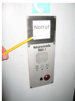
Beschriftung Innen - taktile erfassbar