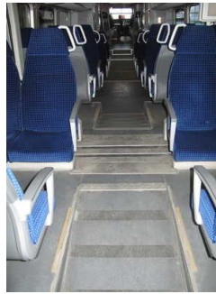
Übergänge - müssen nicht genutzt werden

Anmerkungen für den Gast: 93 cm lange Neigung vom Eingangsbereich zu den Rollstuhlplätze vorhanden. 185 cm breit; Neigung 12%.